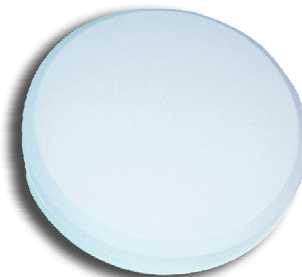
Abbildung Typ KR