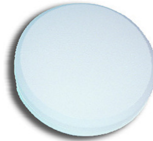
Abbildung Typ RKR