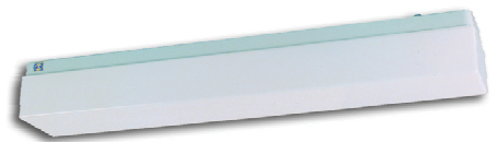
Abbildung Typ TO